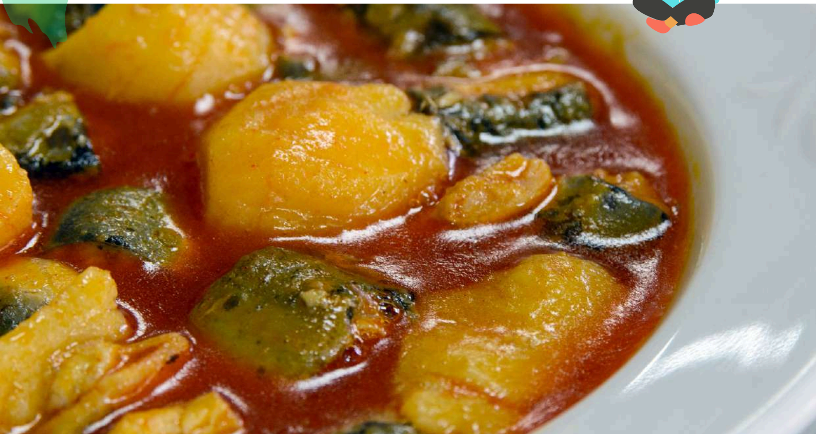
All i pebre . Plato tradicional valenciano.

El all i pebre de anguila es un delicioso guiso valenciano que se hace con anguila, guindilla, ajo, pimentón seco y patatas, entre otros ingredientes. Este plato que tiene una larga tradición, proviene del Parque Natural de la Albufera de Valencia , laguna costera protegida de gran valor, y que fue fuente de inspiración de la famosa novela del escritor valenciano Vicente Blasco Ibáñez, Cañas y Barro .