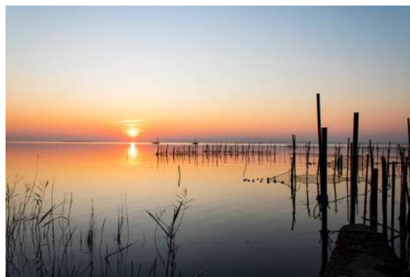
Paisaje de La Albufera.

¡Cuidemos La Albufera para seguir disfrutando de nuestros platos tradicionales!