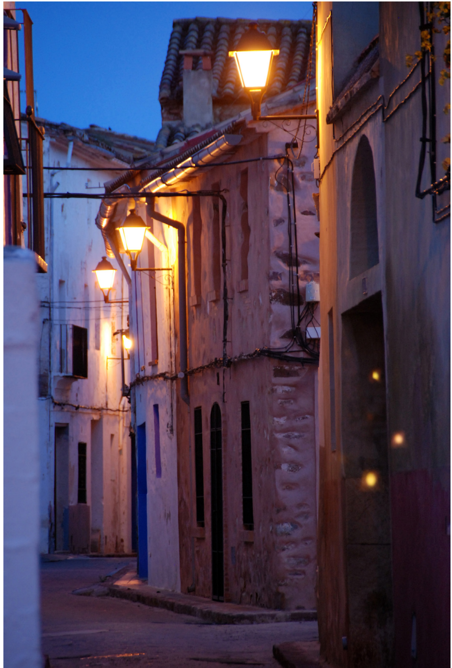
Casco antiguo Benifairó de les Valls.