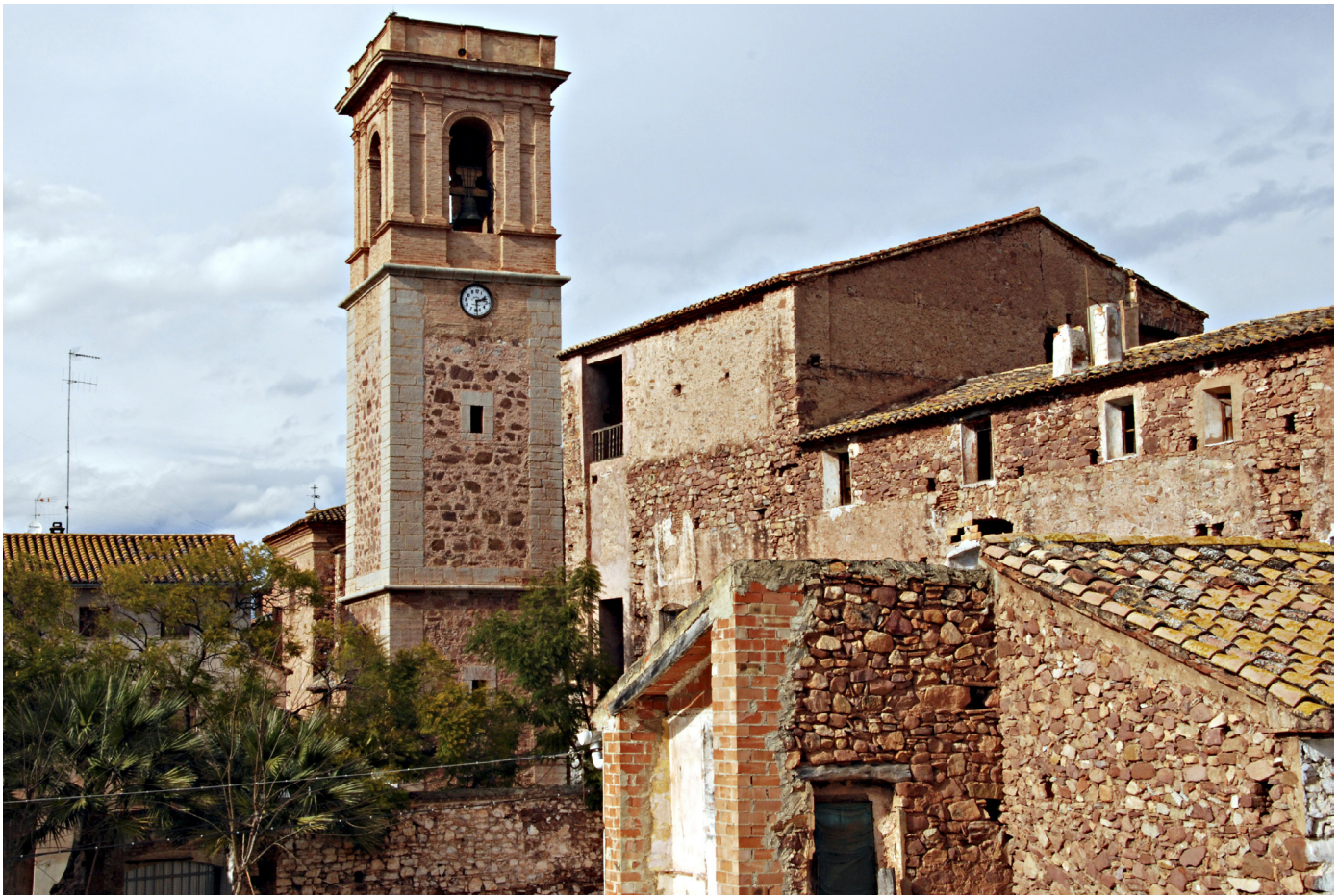
Palacio y campanario Benifairó de les Valls.