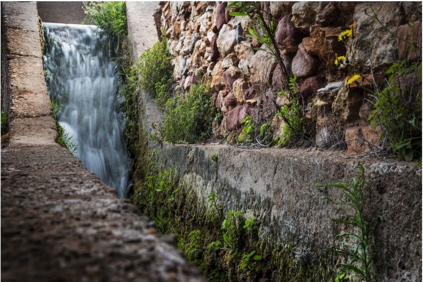
Caída de la acequia Mare Font de Quart de les Valls rodeando el molino.