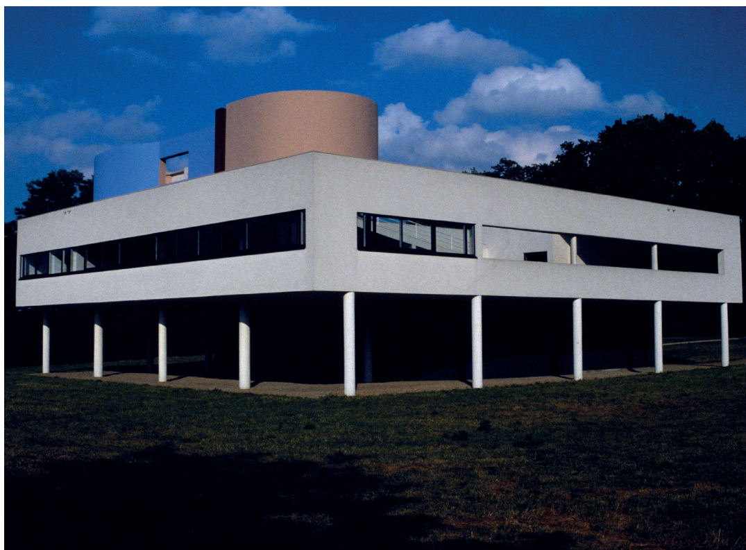
FIG. 1 1. Villa Savoye, 1984. FLC

Palabras clave: Villa Savoye, Historiografía de la Restauración, Gury/Véret, Historia de la recepción, Crítica del documento y Fuentes.