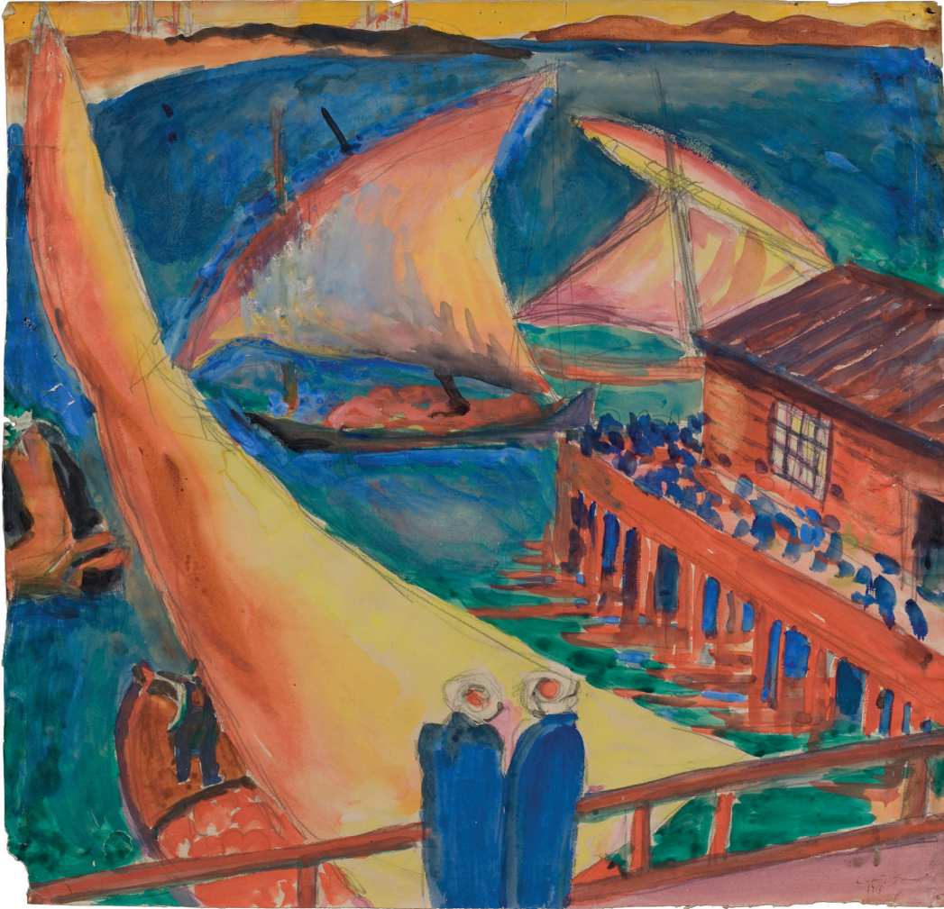
Le Corbusier. "Souvenir Turc Marmara". 1914. Mine, graphite, aquarelle, gouache sur papier à grain, 50x53 cm. FLC 4090b