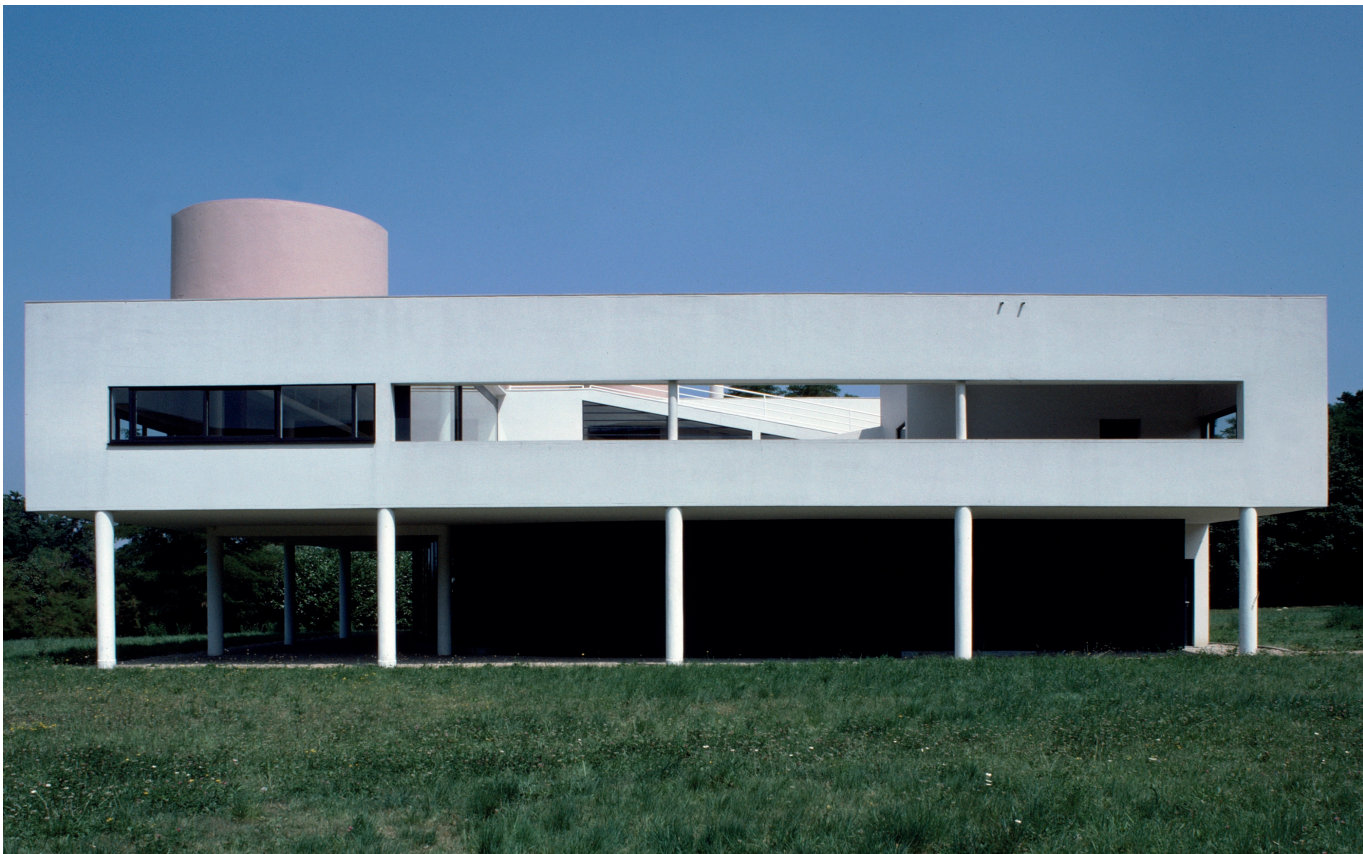
Le Corbusier. Villa Savoye. 1984. FLC