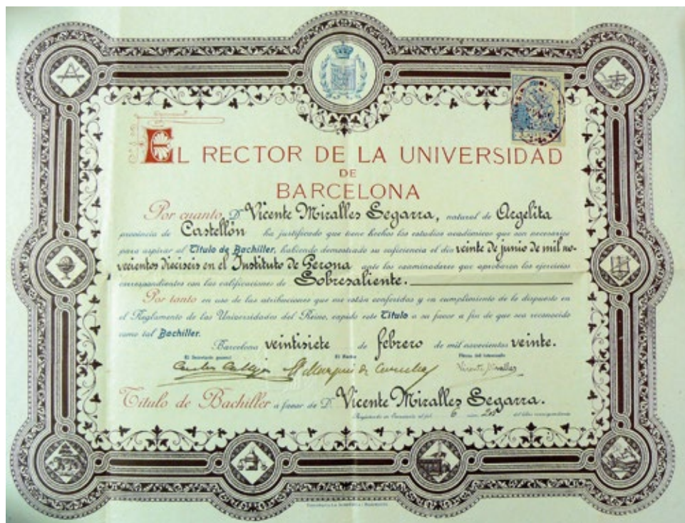
| 2 | Títol de Bachiller expedido en Barcelona en 1920. Títol de batxiller expedit a Barcelona el 1920.

La Universidad de Barcelona le expidió su título de Bachiller, con la calificación general de sobresaliente, el 27 de febrero de 1920, acreditando así sus estudios en el Instituto de Gerona en el que demostró su suficiencia el 20 de junio de 1916.