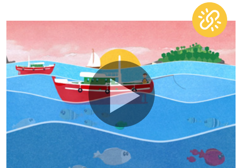
VÍDEO | ODS 14: Vida Submarina UN Etxea - Asociación del País Vasco para la UNESCO