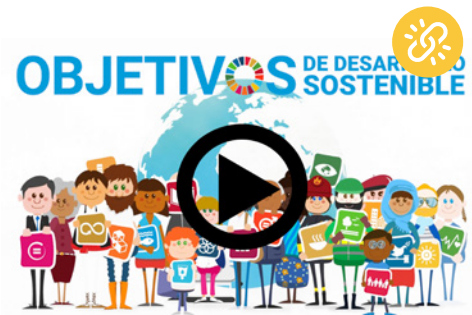
VÍDEO | Objetivos de Desarrollo Sostenible | UN Etxea - Asociación del País Vasco para la UNESCO