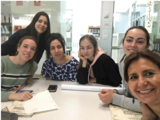
Organizando el programa en la UPV

Hasta el momento ningún estudiante de Bellas Artes había llevado a cabo el APS en Casa Caridad.